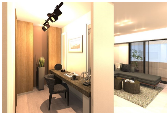
モデルルームイメージ(ワークスペース)