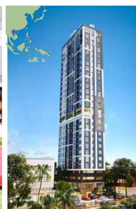
〈外観イメージ画像〉