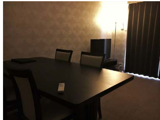
〈ダイニングルーム〉