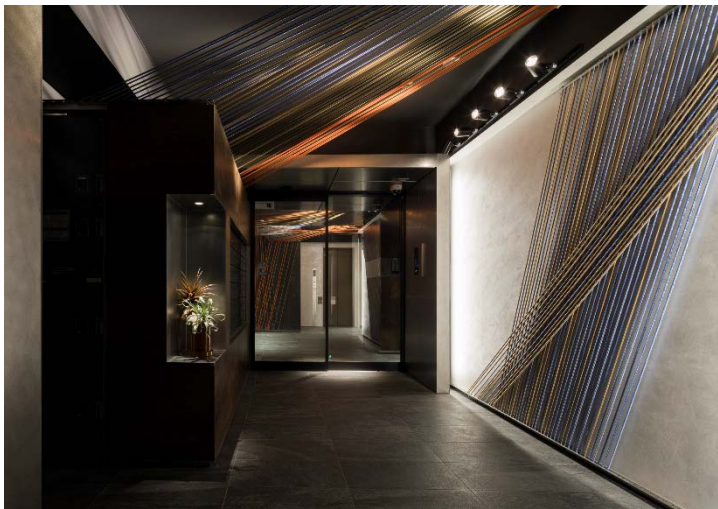
＜ストリングアートをモチーフにしたエントランス＞