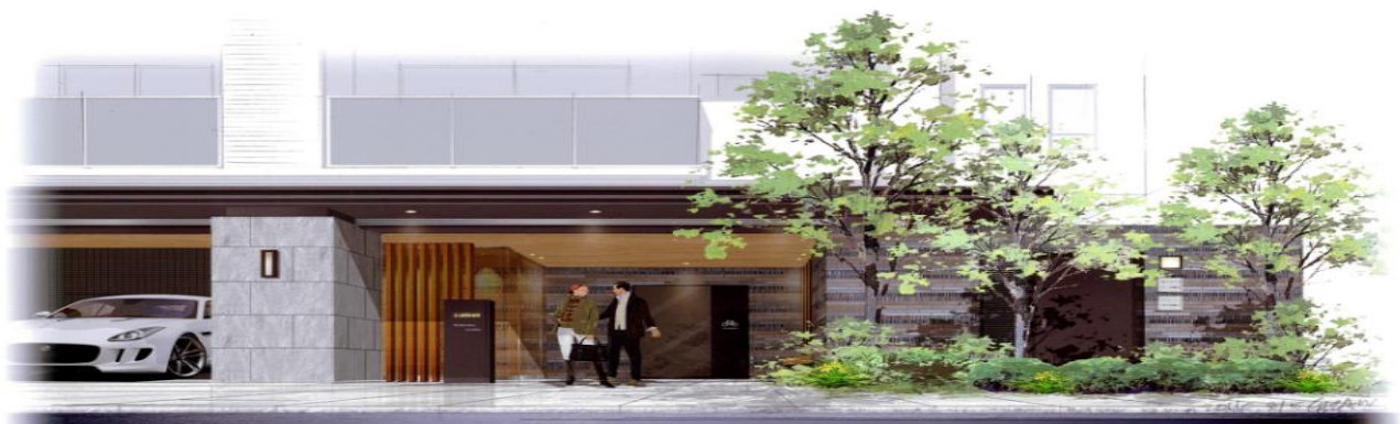
※ラ・アトレレジデンス大橋 完成予想図