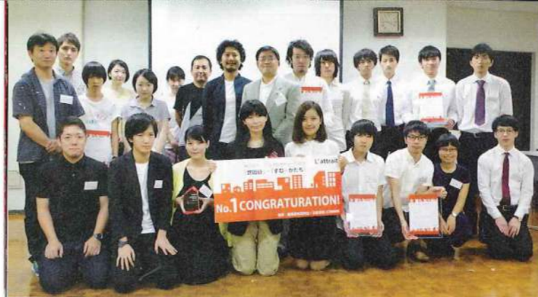
プレゼンテーションを行ったファイナリスト8組と審査員一同