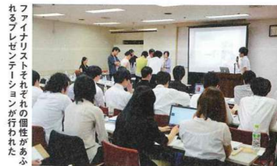
ファイナリストそれぞれの個性が表れるプレゼンテーションが行われた