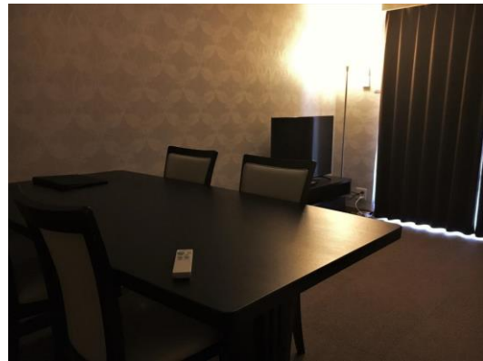
〈ダイニングルーム〉